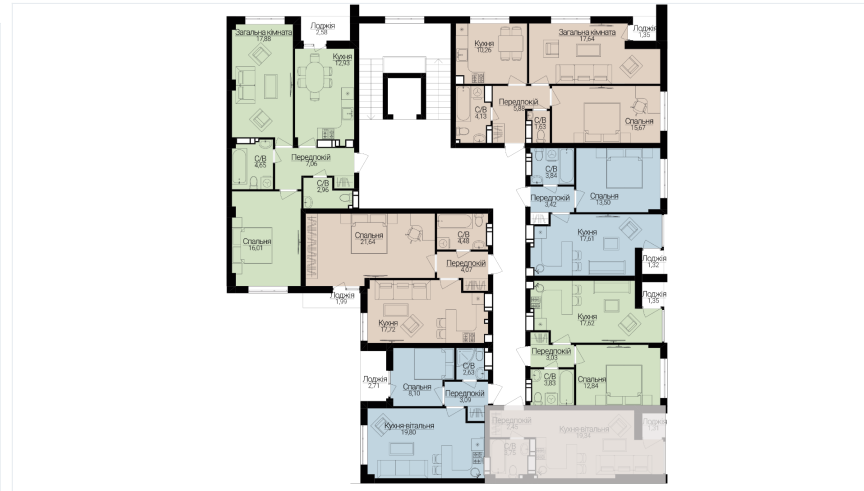
Розташування на генплані